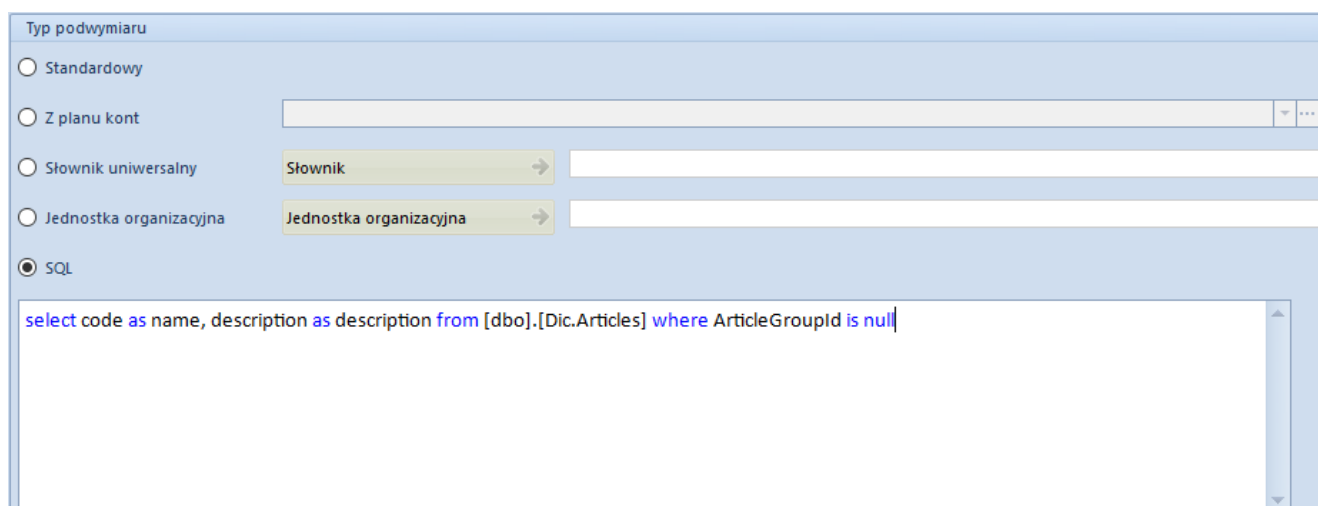
Formularz podwymiaru o typie SQL

Po zaznaczeniu na podwymiarze typu SQL zostanie wyświetlone pole tekstowe, umożliwiające wprowadzenie zapytania SQL.