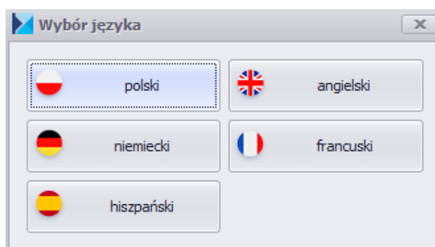
Okno wyboru języka

Po uruchomieniu narzędzia Konfigurator Comarch ERP Altum , pojawi się okno z wyborem języka.