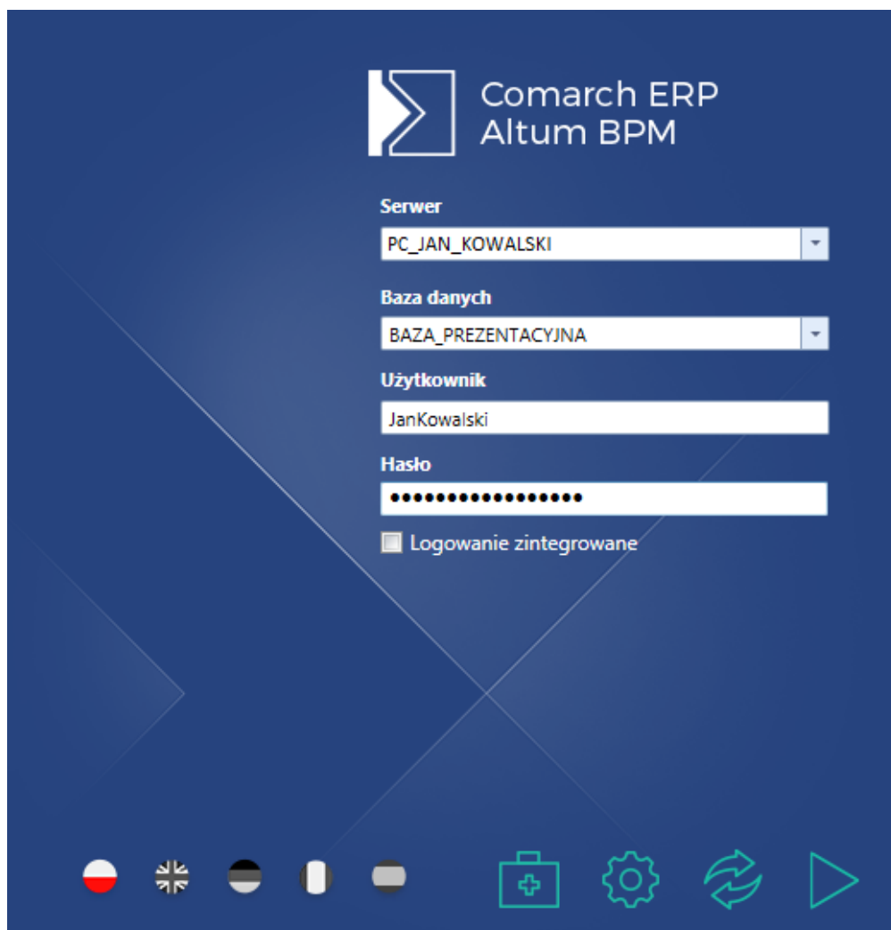
Okno logowania do edytora BPM

Edytor BPM jest aplikacją, która pozwala na zarządzanie procesami BPM, a także definiowanie ich struktury i działania. Po uruchomieniu aplikacji Comarch ERP Altum BPM w pierwszej kolejności otwiera się okno logowania.